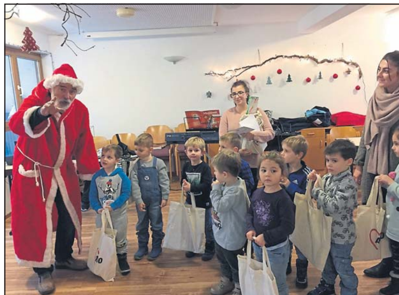
Der Nikolaus verteilte an die Kindergartenkinder Bastelpräsentate.