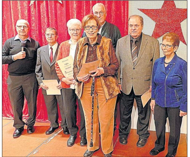
Die Geehrten für zehnjährige Mitgliedschaft in der BSG.