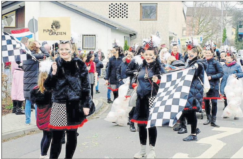
Auch die „Punk-Grazien“ waren mit viel Spaß dabei.