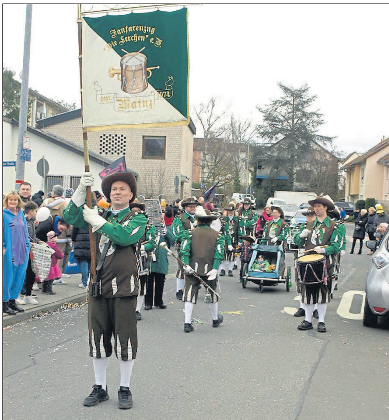
Immer wieder gern gesehene Gäste beim Budenheimer Umzug: der Fanfarenzug „Die Lerchen“.

Nicht nur vor dem Rathaus hatte sich eine große Menschenmenge versammelt, auch auf dem Zugweg wurden die Teilnehmer bejubelt. Mit dabei waren unter anderem die Feuerwehr Budenheim, die den Zug sicherte, die Budenheimer Kindergärten, die Schnorrerfrauen, die „Bunte Schar“ der Turgemeinde, die CDU Budenheim, das Blütenhaus und die Punk-Grazien. Von befreundeten Carnevalsvereinen waren Vertreter der Maletengarde Mombach, aus Heidesheim sowie die Finter Reservisten mit dabei. Für die musikalische Begleitung der Zugteilnehmer sorgten „Die Rhiorevoluzzer“ mit ihrer Guggemusik sowie der Fanfarenzug „Die Lerchen“.