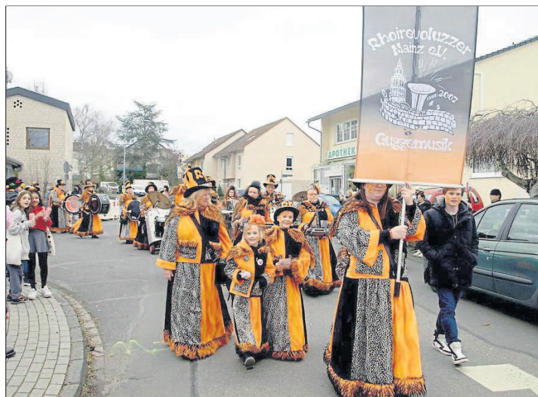
Die „Rhoirevoluzzer“ waren mit ihrer Guggemusik ein Stimmungsgarant.