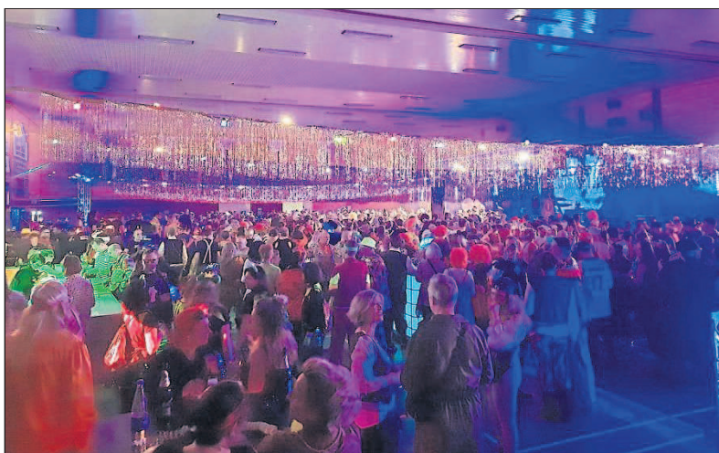
In der Haupthalle sorgten die „Grumis“ für Stimmung.

würzt mit der Guggemusik der „Rhoirevoluzzer“, den Humbas und Oliver Mager, sorgte für Riesenstimmung im Haus. Die Befürchtung, die Gäste könnten ausbleiben, bewahrheitete sich nicht. Wie auch bei den Sitzungen zeigte sich deutlich, dass die Budenheimer und Fans von drumerum die Fassenacht vermisst hatten.