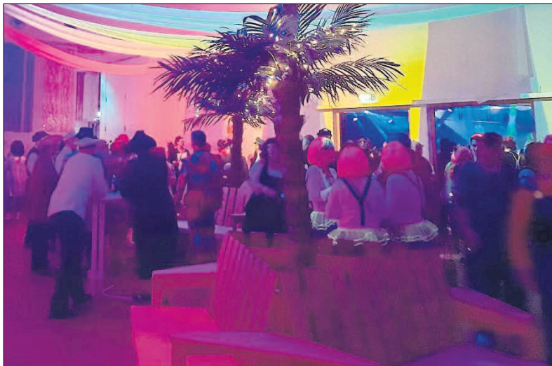
Beliebter Treffpunkt war auch in diesem Jahr die Sektbar.

Budenheim. Auftakt der Fassenacht ist in Budenheim traditionell der Altweiberdonnerstag. Während auf den Straßen noch geschnorrt wurde, legte der CCB bereits letzte Hand an die Vorbereitungen für den Altweiberball. Die bewährte Kombination Partyband „Grumis“ in der Haupthalle und DJ Mike in der Disco, das Ganze ge-