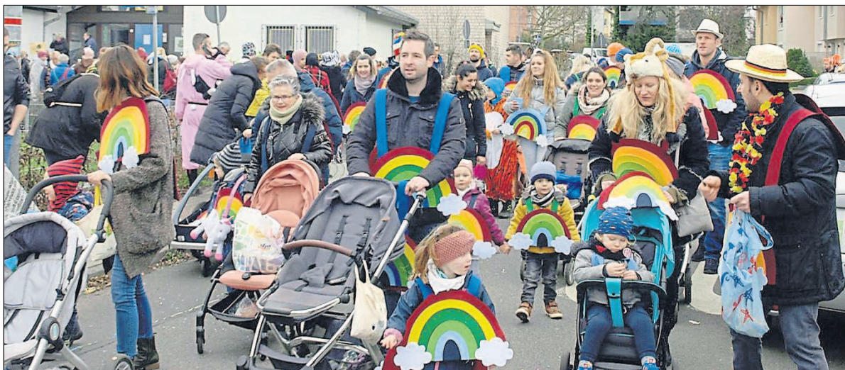
Der Beitrag der Kita Regenbogen.

Nicht nur vor dem Rathaus hatte sich eine große Menschenmenge versammelt, auch auf dem Zugweg wurden die Teilnehmer bejubelt. Mit dabei waren unter anderem die Feuerwehr Budenheim, die den Zug sicherte, die Budenheimer Kindergärten, die Schnorrerfrauen, die „Bunte Schar“ der Turgemeinde, die CDU Budenheim, das Blütenhaus und die Punk-Grazien. Von befreundeten Carnevalsvereinen waren Vertreter der Maletengarde Mombach, aus Heidesheim sowie die Finter Reservisten mit dabei. Für die musikalische Begleitung der Zugteilnehmer sorgten „Die Rhiorevoluzzer“ mit ihrer Guggemusik sowie der Fanfarenzug „Die Lerchen“.