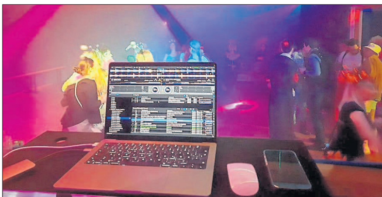
Die ersten Tänzer in der Disco.