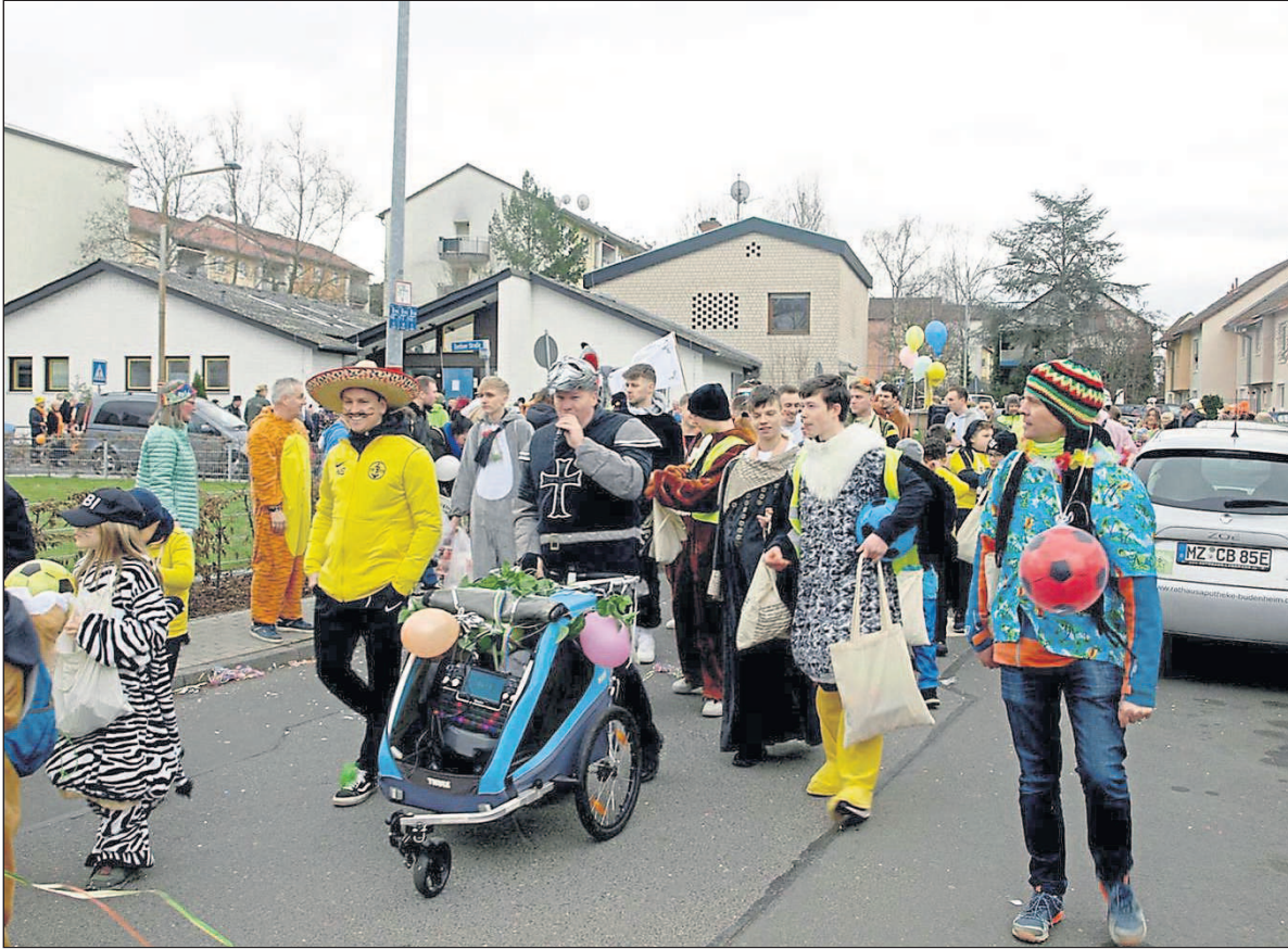
Die Fußballer des FV Budenheim.

kal. Damit es keine traurigen Kinderaugen gab, bekamen alle teilnehmenden Kindergärten einen Kinderladen-Gutschein in Höhe von 111 Euro. Dafür dankt der CCB den Sponsoren Sanitär Becker, Bäckerei Berg, Holzwerkstätte König und Lotto am Eck).