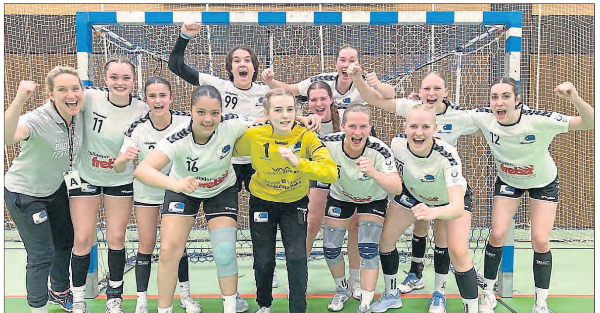
Die U19 der Budenheimer Sportfreundinnen dürfen sich auch in der kommenden Saison mit den besten Jugendhandballteams Deutschlands messen.

Budenheim. – Das erste Qualifikationsspiel in der Hauptrunde gegen den späteren Gruppensieger TSG Bretzenheim hatten die Budenheimerinnen am Vortag trotz einer starken Abwehrleistung hauchdünn mit 16:17 verloren. Dem zweiten Spiel gegen die TSG