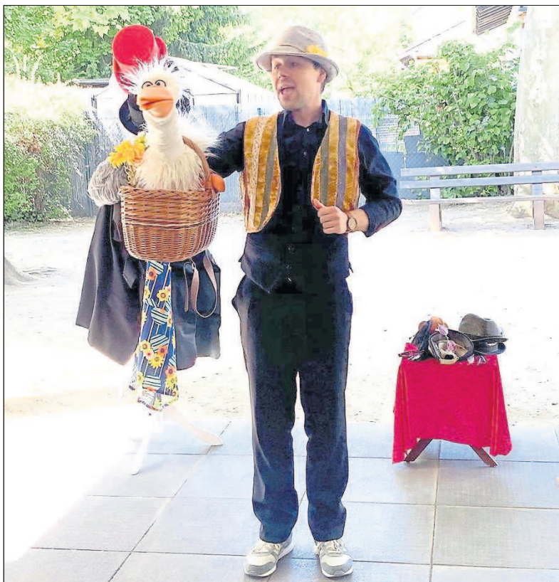
Das Galli Theater Mainz besuchte bereits zum vierten Mal die Kita Kunterbunt und führte das Märchen „Hans im Glück“ auf. Mit großer Begeisterung schauten die Kinder gespannt zu und konnten sich aktiv beteiligen und mitspielen. Dank der Organisation und Finanzierung durch den Förderverein und auf Spendenbasis der Eltern konnten alle kleinen und großen Zuschauer eine tolle Vorstellung erleben.

schreibens ausgehändigt. Im Anschluss wurden dann von allen Fotos gemacht und danach zum gemütlichen Teil mit einem Buffet übergegangen. Der Abend klang mit herzlichen Gesprächen und guter Laune aus.