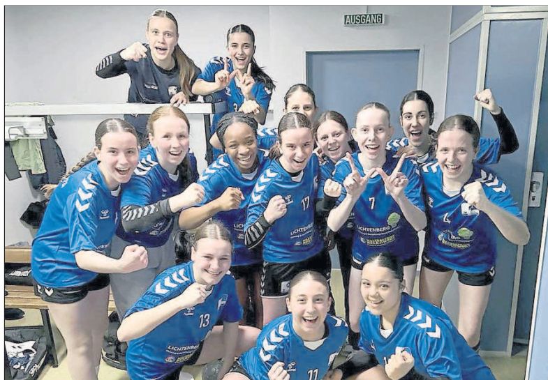
Die Budenheimer A-Mädels wollen sich am Wochenende ihr Jugendbundesliga-Ticket sichern. Das haben ihre männlichen Altersgenossen bereits getan – doch sie wollen ihren Zweitliga-Platz in Solingen gegen einen in der Ersten Jugendbundesliga tauschen.

Die weibliche A-Jugend-Bundesliga wird in der kommenden Saison erstmals als komplette Runde gespielt – und nicht wie in den Vorjahren als Ergänzungs-Spielbetrieb, in denen einige Teams lediglich sechs Partien zu absolvieren hatten. Die U19-Mädels der Budenheimer Sportfreundinnen wollen dabei sein und müssen sich dafür am Samstag und Sonntag beim Vierer-Turnier in Mundenheim im Modus „jeder gegen jeden“ bei 2 x 20 Minuten Spielzeit qualifizieren. Nur Platz 1 hat das JBLH-Ticket direkt gebucht, die Plätze 2 und 3 haben eine Woche später eine zweite Chance, sich einen der begehrten Startplätze zu sichern. Teilnehmer sind je zwei Mannschaften aus Rheinland-Pfalz – neben den Sportfreundinnen handelt es sich dabei um das Ludwigshafener Gastgeber-Team JSG Mundenheim/ Rheingönheim – und aus