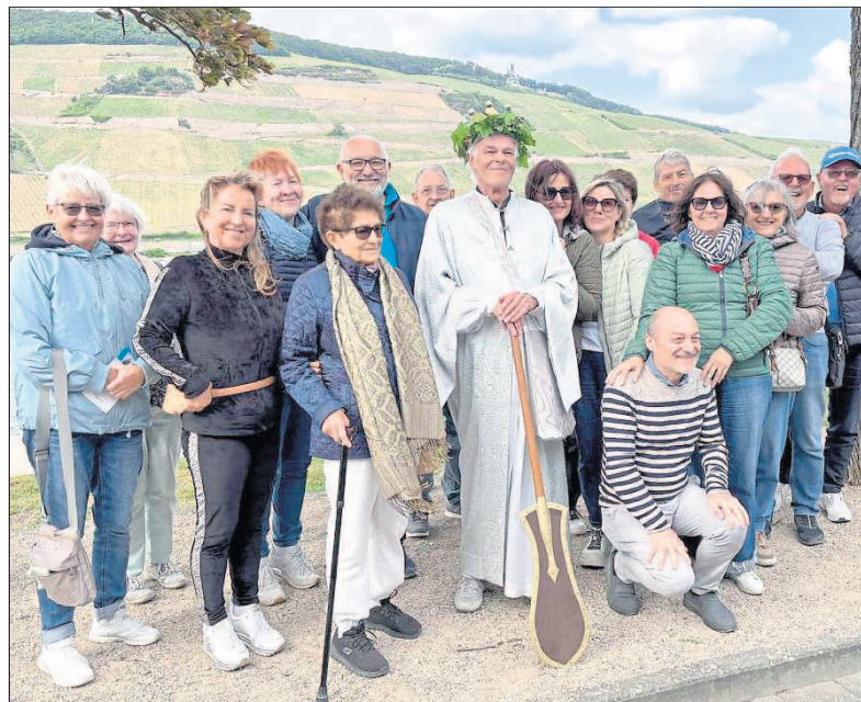
„Vater Rhein“ begrüßte die Besucher am Rheinufer.