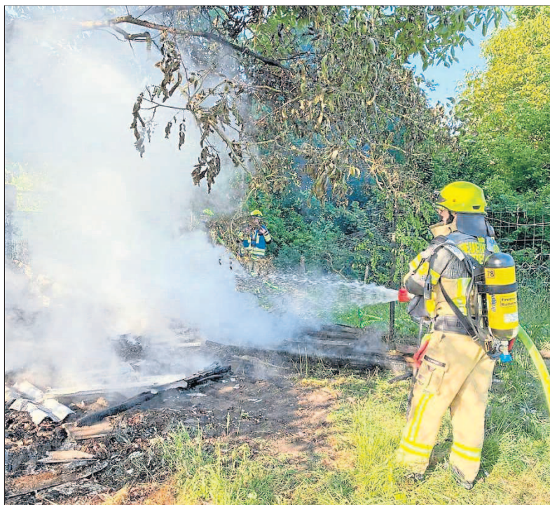
Ein Gartenhausbrand zwischen Budenheim und Uhlerborn erforderte den Einsatz von einem Tanklöschfahrzeug und zwei Löschgruppenfahrzeugen.

Der Freitagabend stand dann wieder im Zeichen der Ausbildung: Beim regulären Übungsdienst wur-