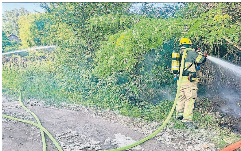
Auch Hecke entlang des Bahndamms zwischen Budenheim und Mombach musste gelöscht werden.

de ein Fahrzeugbrand simuliert, der auf ein angrenzendes Gebäude übergrieff. Mehrere Personen mussten gerettet werden. Unterstützt wurde die Übung von zwei Personen, die sich spontan für einen Besuch bei der Feuerwehr entschieden hatten und direkt in das Geschehen eingebunden wurden.