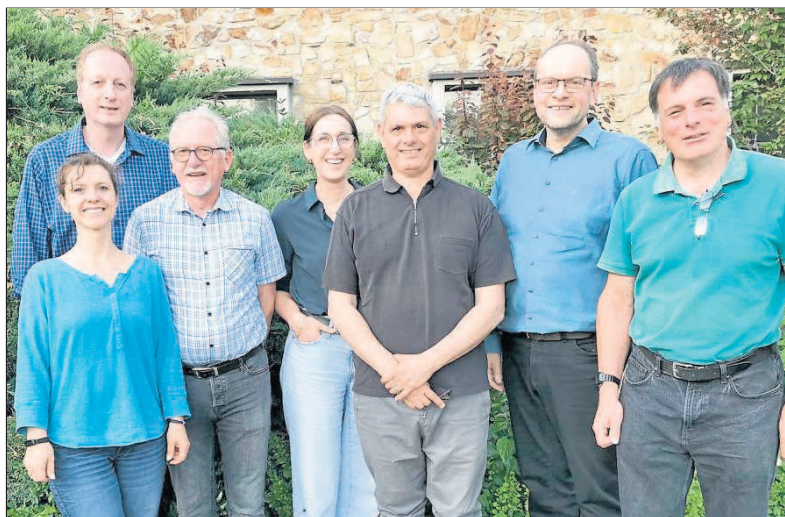
Der neu gewählte Vorstand des Fördervereins Pankratiuskirche Budenheim.

Doch die Pflege des Budenheimer Wahrzeichens ging und geht weiter: Reparatur der Kirchenmauer, Gestaltung des Kirchgartens, Modernisierung der Küchenausstattung für Großveranstaltungen und, und, und. Die Pankratiuskirche soll zu einem Zuhause werden – ein Zuhause für den Glauben und für Begegnungen; durch Gottesdienste, Ausstellungen, Konzerte, Le-