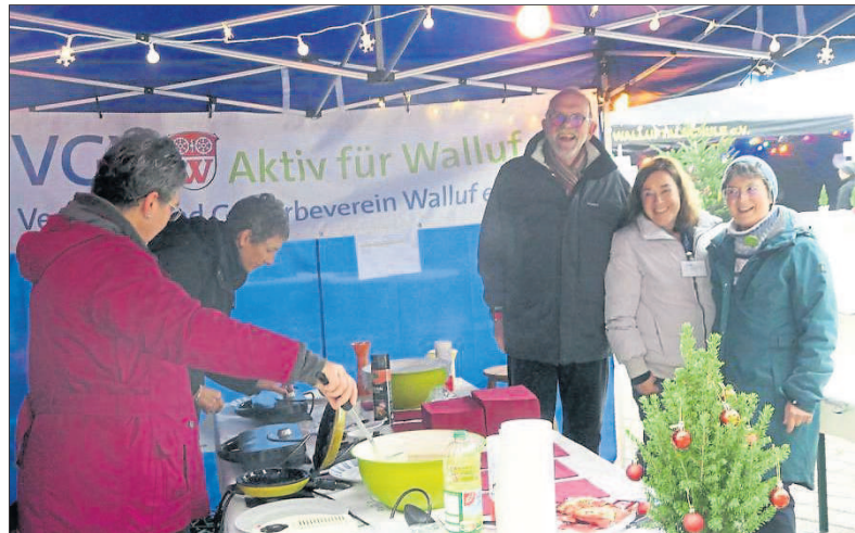
Der VGV ist Träger des Weihnachtsmarktes. Hinten im Bild der 1. Vorsitzende.

Es beteiligten sich wieder zahlreiche Vereine und Gewerbetreibende aus der Gemeinde und der Umgebung an dem Weihnachtsmarkt. Und so war das Angebot bunt, vielfältig und abwechslungsreich. Handwerkliches stand im Fokus: