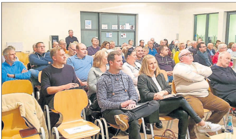
Die Mensa der Lennebergschule war gut besetzt.

der Schulsozialarbeit geplant. Im Seniorenzentrum gibt es die betreute Wohnanlage mit 21 Wohnungen, elf Wohneinheiten der Wohnbau sowie zehn Eigentumswohnungen. Das Seniorentreff-Team habe sich sehr bewährt und bestehe aus drei Hauptamtlichen, drei Minijobber sowie zehn ehrenamtlich Beschäftigten. Das Förderprogramm umfasse 1,56 Millionen Euro Chancenbudget für zehn Jahre.