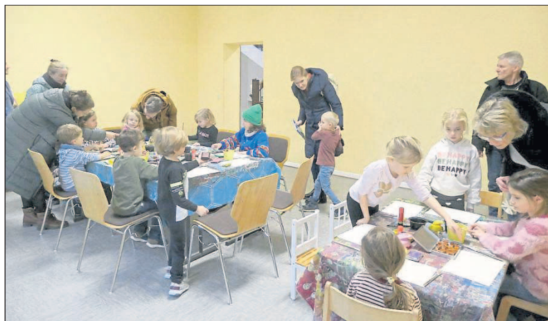
Kreativ werden konnten die Kleinen bei einem Mitmach-Workshop.

Adventskränze, weihnachtliche Dekor, Schmuckstücke für sie und ihn und vieles mehr.