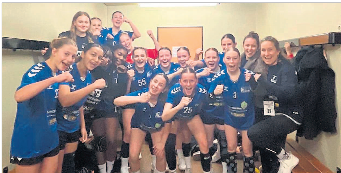
Die Freude über den Sieg war bei den U17-Mädels groß.

Die Partie begann ausgeglichen, wobei sich beide Teams zunächst schwer taten, klare Torchancen herauszuspielen. Nach dem frühen Rückstand fand Budenheim besser ins Spiel und konnte sich Mitte der ersten Halbzeit erstmals leicht absetzen. Zwar schlichen sich im Angriff immer wieder Ballwegwürfe und Abstimmungsprobleme ein, doch eine stabile Abwehr und konsequente Abschlüsse sorgten für eine 11:8-Führung zur Pause. Auch nach dem Seitenwechsel blieb das Spiel von Fehlern auf beiden Seiten geprägt. Budenheim ließ durch taktische Ungenauigkeiten und vergebene Chancen mehrfach die Möglichkeit liegen, den Vorsprung frühzeitig deutlicher auszubauen. Dennoch