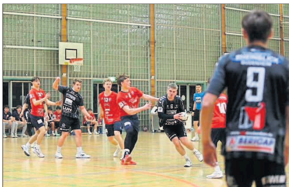
Im gebundenen Spiel hatte die DJK Budenheim Bietigheim über weite Strecken gut im Griff.