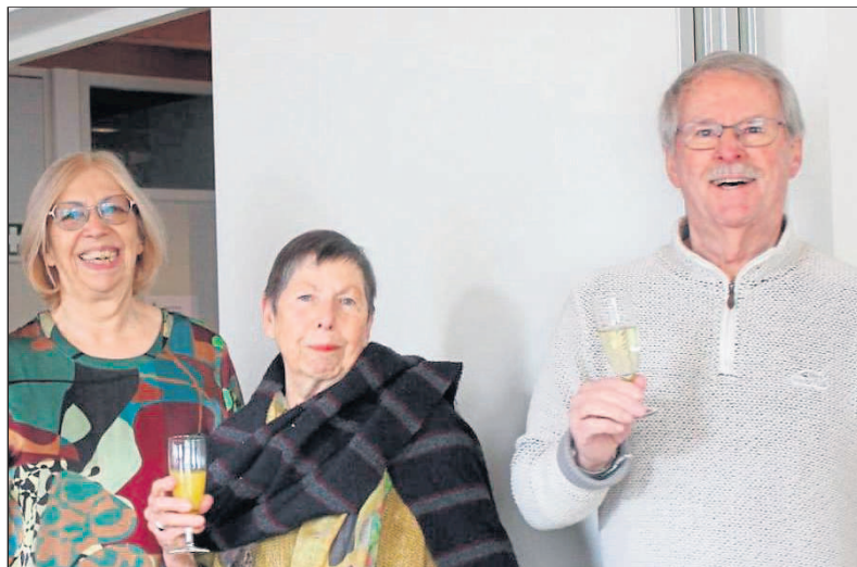
Mit einem Glas Prosecco wurde auf das neue Jahr angestoßen.

war. Gut gelaunt verbrachten die anwesenden DIF-Mitglieder gemeinsam einen angenehmen Tag.