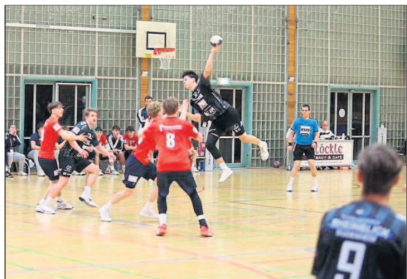
Das erste Pflichtspiel nach der Winterpause, inklusive körperbetonter Einsätze.

Am Ende stand eine deutliche Niederlage, bei der vor allem die Vielzahl eigener Fehler, die schwache Abwehrleistung und mangelnde Effizienz im Angriff ausschlaggebend waren.