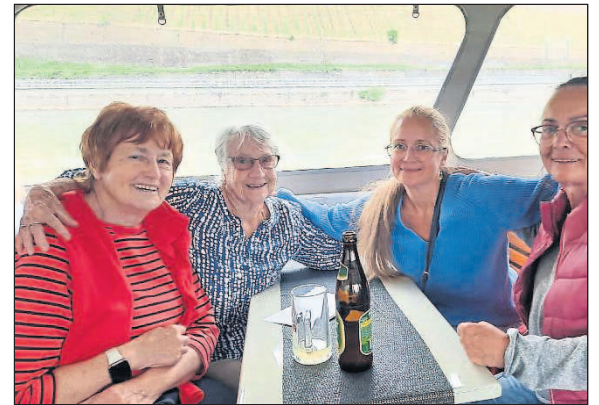
Eine lustige Frauengruppe war auch an Bord.