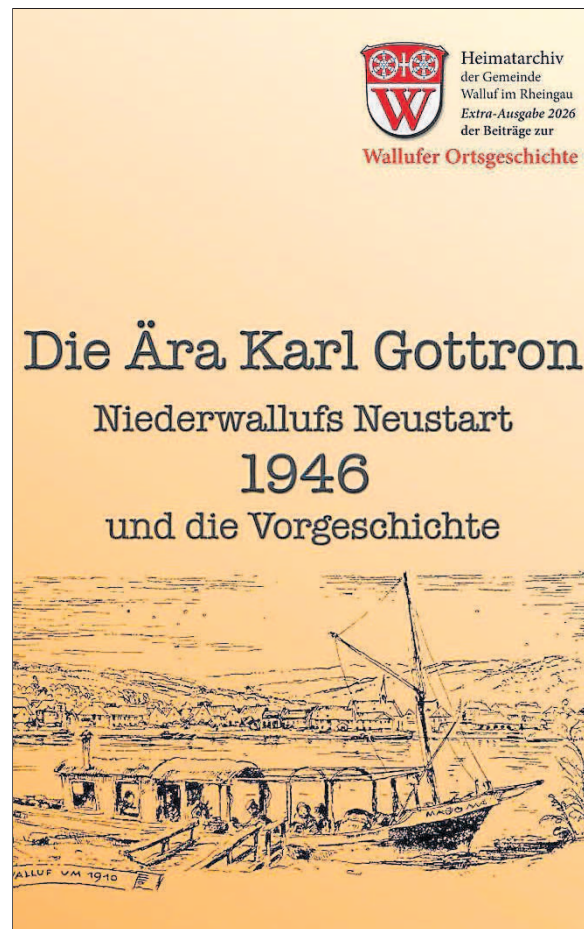
Die neue Broschüre des Heimatarchivs.

Erhältlich ist die Broschüre während der Öffnungszeiten in der Bürgerinformation im Rathaus sowie im Weltladen Walluf zum Verkaufspreis von 2,50 Euro.