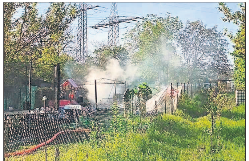
Der Brand einer Gartenhütte wurde gelöscht.