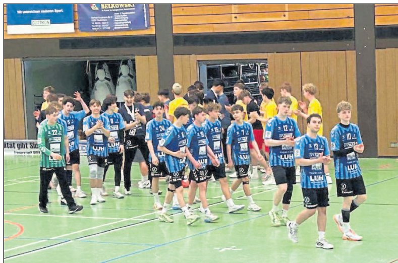
Die Jungs bedankten sich bei ihren Fans.

Es wurde weiterhin hochkonzentriert aufgespielt, flexibel ausgewechselt und bis zum Schluss gekämpft, was sich mit einem 3:2-Sieg auszahlte. Nach einer Feedbackrunde und dem ersten Mannschaftsfoto endete ein toller erster Ligatag.