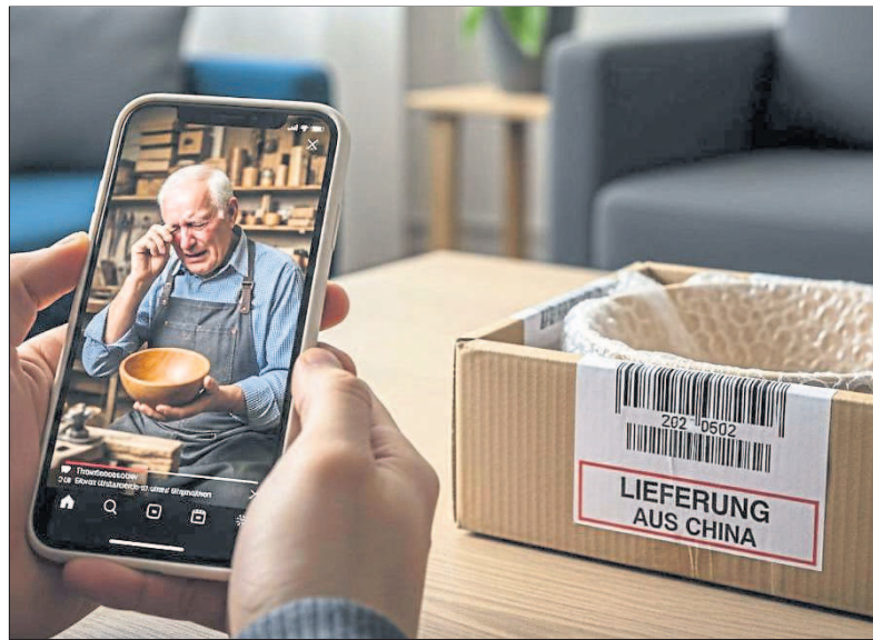
Mitleids-Masche: Das Video verspricht Handarbeit – geliefert wird Billigware aus Asien.

Die Masche verbreitet sich überall: TikTok erreicht 26,4 Millionen Nutzer in Deutschland (besonders 18- bis 29-Jährige), Facebook 47,2 Millionen (vor allem über 35-Jährige), YouTube 32,24 Millionen wöchentliche Nutzer. Instagram verzeichnet 130 Millionen Shopping-Klicks pro Monat weltweit. WhatsApp dient der persönlichen Kaufabwicklung. Das Statistische Bundesamt meldet: 85 Prozent der 16- bis 24-Jährigen nutzen soziale Medien – aber auch 25 Prozent der 65- bis 74-Jährigen. Ältere Nutzer holen auf, kennen aber oft Betrugsmaschen und KI-Inhalte weniger gut. Die Sicherheitsplattform ScamWatchHQ warnt in ihrem 2026 Scam Trends Report: „Opfer werden von einer Plattform zur nächsten gelockt – von sozialen Medien über WhatsApp zu betrügerischen Zahlungsseiten.“ Multi-Channel-Kampagnen stiegen 2025 um 97 Prozent.