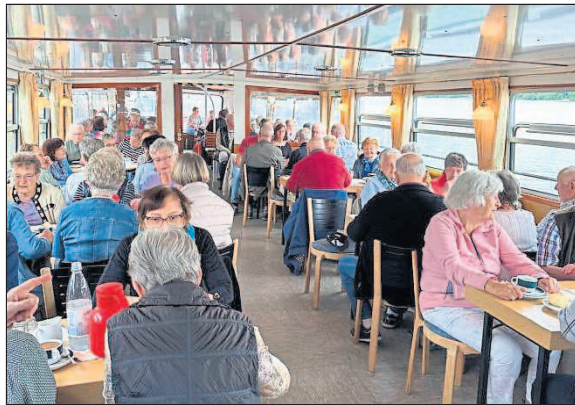
Das Schiff war voll besetzt.

cherlich noch lange in Erinnerung bleiben wird.