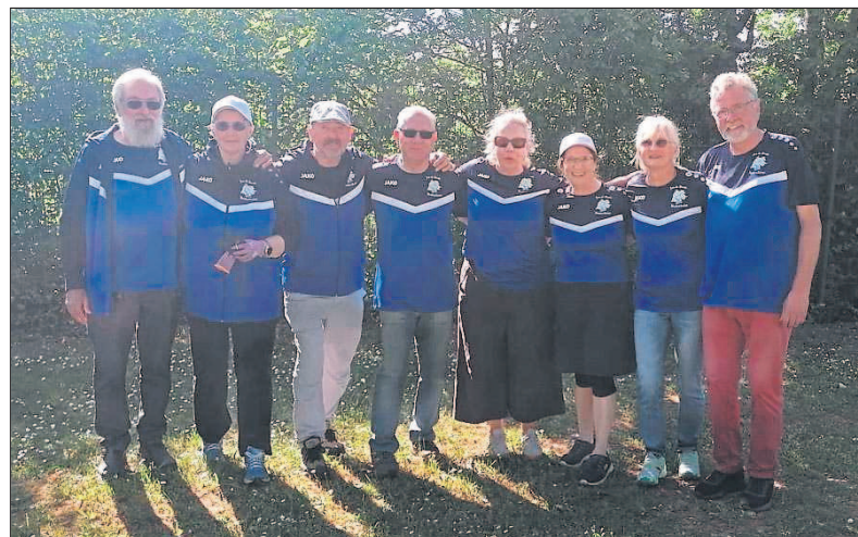
Die neue zweite Ligamannschaft nach ihrem ersten erfolgreichen Tag in der Bezirksklasse.