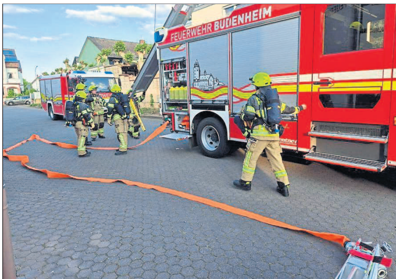
Übungsdienst auf dem Feuerwehrgelände.

natter einzufangen. Das Tier konnte wohlbehalten gesichert und anschließend fachgerecht übergeben werden. Ob groß oder klein: Die Freiwillige Feuerwehr Budenheim ist rund um die Uhr einsatzbereit, hilft Menschen und Tieren und greift ein, wenn Hilfe gebraucht wird – 24/7, freiwillig und engagiert. Wer mal hinter die Kulissen der abwechslungsreichen Arbeit schauen und sich vielleicht auch selbst engagieren möchte, kann gerne vorbeikommen. Die Freiwillige Feuerwehr trifft sich jeden Donnerstag um 18 Uhr und alle vierzehn Tage freitags um 19 Uhr.