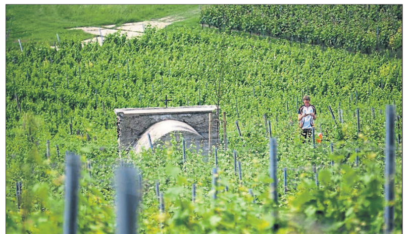
Ein Orientierungslauf ist eine anspruchsvolle Disziplin.

Die Turngemeinde 1886 Budenheim freut sich auf viele bekannte und neue Gesichter bei diesem besonderen Jubiläumslauf.