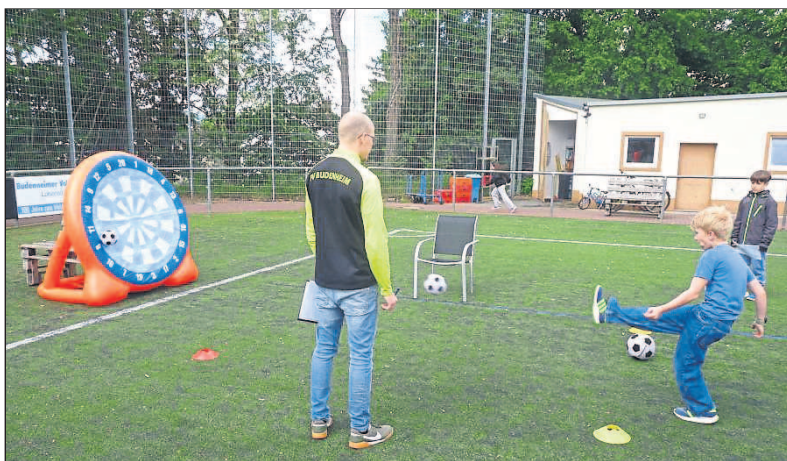
Beim Fußball-Darts konnten die Kids ihr Können unter Beweis stellen.