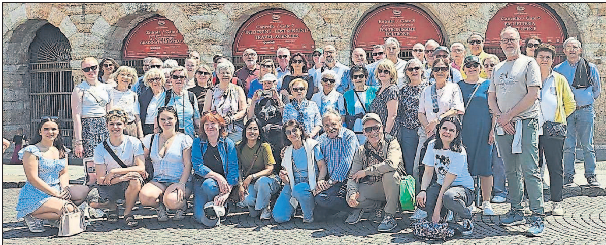
Foto der Reisegruppe aus Budenheim.