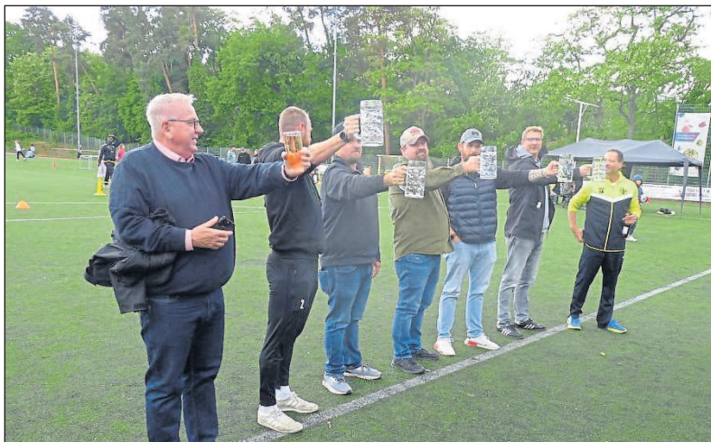
Das Maßkrugstemmen ist eine ziemlich anstrengende Disziplin.

vom CCB/TGM einmarschiert und boten eine grandiose Vorstellung. Beim ersten Wettbewerb wurde der erste Budenheimer Elferkönig gesucht. Nach einem spannenden Elferschießen konnte sich der Sieger über einen 200-Euro-Gutschein von Portofino freuen. Nachdem die Glitterkids noch eine Zugabe zum Besten gaben, ging es weiter mit dem Maßkrugstemmen. Der Sieger konnte nicht nur über 14 Minuten das schwere Glas oben halten, er konnte sich danach über ein Mainz-05-Trikot mit allen Unterschriften der Spieler freuen. Über einen Airfryer konnte sich die Elferkönigin freuen. Beim Schussmessgerät kam der Beste, ein Junge aus der eigenen B-Jugend des FV Budenheim. Mit 115 km/h Geschwindigkeit konnte er sich über einen Gutschein für ein Wochenende für fünf Personen bei die-Jugendherbergen.de freuen. Gegen 18 Uhr ließ man das schöne Fest noch mit einem Schoppen ausklingen. Es war ein gelungenes Fest und ein schöner Vatertag für Jung und Alt. Die Jugendabteilung des FV 1919 Budenheim war mehr als zufrieden und freut sich schon auf das nächste Jahr.