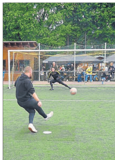
Der 11-er-König in Aktion.