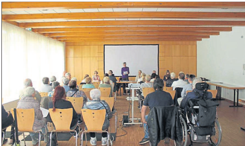
Mitgliederversammlung des VdK-Ortsverbandes Budenheim am 16. Mai.

TGM Budenheim statt. Auch Nichtmitglieder sind eingeladen, im Rahmen eines vierwöchigen Probetrainings unverbindlich teilzunehmen. Weitere Informationen zum Sportprogramm der TGM Budenheim sind online unter www.tgm-budenheim.de sowie über die Social-Media-Kanäle @tgmbudenheim auf Instagram und facebook.com/tgmbudenheim zu finden. Für Fragen steht das Team der TGM Budenheim zu den Geschäftsstellenzeiten – dienstags in der Zeit von 9 bis 12 Uhr, mittwochs von 9 bis 12 Uhr und 14 bis 17 Uhr – persönlich, telefonisch unter 06139-8788 oder per E-Mail an info@tgm-budenheim.de zur Verfügung.