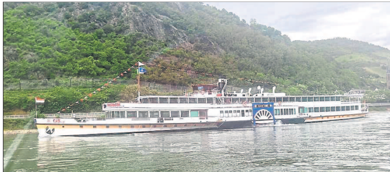
Auf dem Rückweg begegnete man dem K. D. Raddampfer Goethe.

man im Laufe der Jahre Neukirchen am Großvenediger, Berwang, Tannheim, Zell am See, Fiesch, den Stubaier Gletscher, Galtür, Sexten und in den letzten Jahren das Klein-Walsertal.