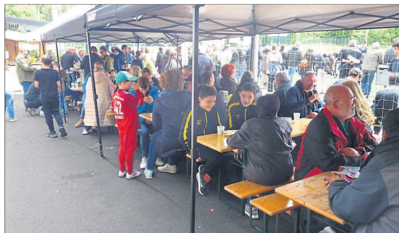
Auf dem Sport- und Spielefest des FV Budenheim war richtig viel los.