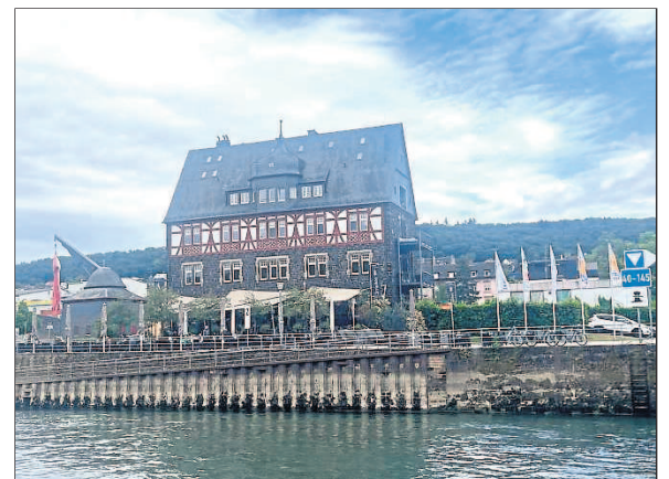
Das Zollamt in Bingen wurde passiert.

Die Vielfalt der Freizeitmöglichkeiten zeigt sich auch bei den Starts im Triathlon in Mainz, und in den vergangenen Jahren war man bereits über zehnmal in Würzburg dabei. Jedes Jahr haben durchschnittlich 30–40 Aktive das Deutsche Sportabzeichen geschafft und die Sportfreunde erreichten meistens Platz drei der Vereine von 601–900 Mitgliedern. Zurück in Budenheim von einer herrlichen Jubiläums-Schiffstour werden sich die Ski- und Freizeitleiter gerne an diesen Tag erinnern.