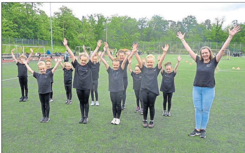
Der Gardetanz steht hoch im Kurs.