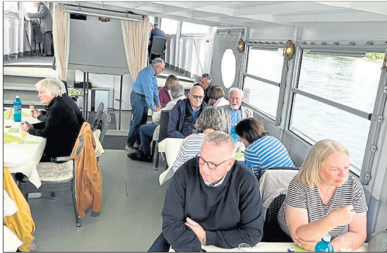
Vereinsgeschichten wurden auf der Schifffahrt ausgetauscht.

Die Skiausfahrten begannen mit Tagesausflügen am Wambacher Hang ab 1977 mit der ersten Vereinsmeisterschaft. So besuchte