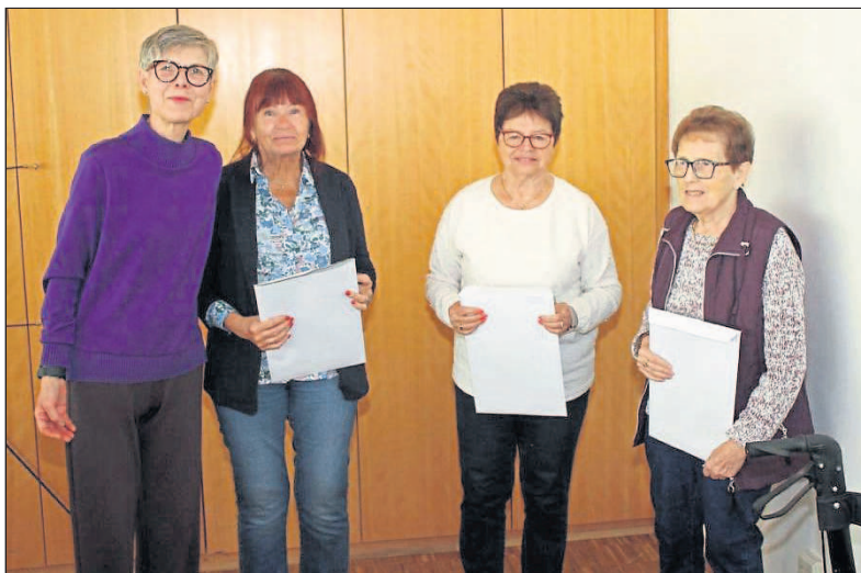
Ehrungen langjähriger Mitglieder.