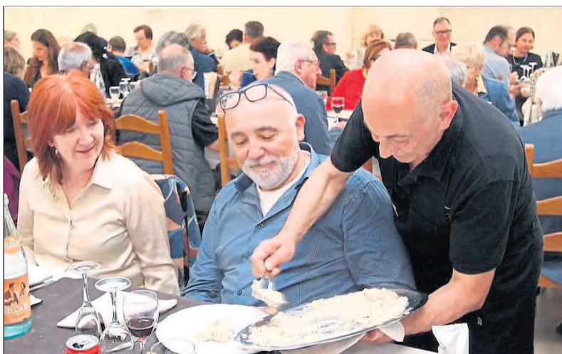
Das schmackhafte Risotto all'Isolana wird serviert.