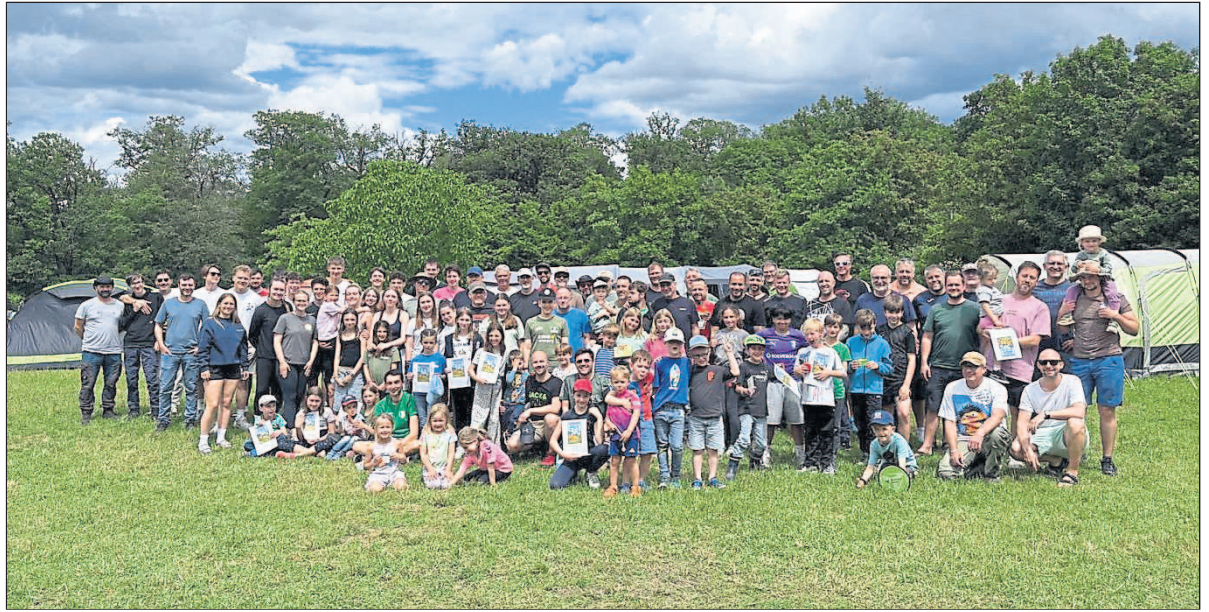
Wenn 111 Menschen in Budenheim fehlen, sind sie beim Väterzelten!

Wenn Budenheims größtes Väterzelten loszieht, reist eine halbe Großküchenausstattung mit: drei Gasbräter, Hockerkocher, riesige Töpfe, Kaffeemaschinen und vieles mehr. Ab Donnerstagabend wird im Akkord geschneidelt, gebraten und gekocht. Es wurde auch mal gegrillt, aber stilvoll mit Pilzpflanze und Salat. Statt des sonst üblichen frisch zubereiteten Gulaschs stand in diesem Jahr deftiges Chili con Carne auf dem Plan. Der absolute kulinarische Höhepunkt folgt jedoch samstags zur Olympiade: Dann wird traditionell Kaiserschmarrn zubereitet. Sage und schreibe 175 Eier wurden von tapferen Vätern erst getrennt und der Eischnee anschließend komplett von Hand geschlagen. Dieses Ritual ist längst Kult, der Schmarrn