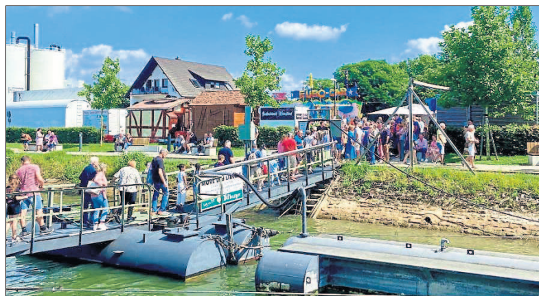
Am Samstag, 27. Juni, können die Gäste zwischen zwei Festen hin- und herpendeln.