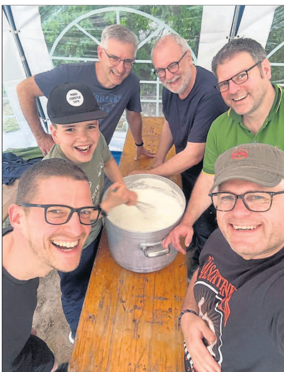
Der legendäre Kaiserschmarrn erfordert eine präzise Zubereitung.

Kindern dazugekommen. So war es eine gemeinsame Fahrt von zwei bis 62 Jahren. Anstelle des Traditionstermins über Fronleichnam findet die Fahrt 2027 über Christi Himmelfahrt statt. Denn es gilt das Motto: Nach dem Väterzelten ist vor dem Väterzelten.