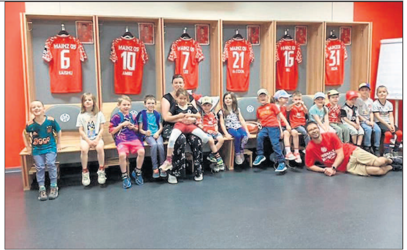
In den „heiligen Hallen“, der Mannschaftskabine des FSV Mainz 05.

die Tour über die Tribünen, von denen die Kinder das Stadion aus der Perspektive der Fans erleben konnten. Anschließend ging es noch durch die Logenbereiche, bevor die Führung endete. Während des gesamten Rundgangs stellten die Kinder viele neugierige Fragen, die der fachkundige Guide Tim kindgerecht und mit viel Geduld beantwortete. Besonders erstaunt waren die Wildschweine, als sie erfuhren, was die Profis nach einem Spiel machen: Erst geht es zur Regeneration ins Eisbad und anschließend wird oft ganz gemütlich eine bestellte Pizza gegessen. Neben den vielen spannenden Einblicken stand vor allem das gemeinsame Erlebnis im Vordergrund. Zusammen unterwegs zu sein, Neues zu entdecken und die Begeisterung für den Fußball zu teilen, machte diesen Ausflug zu etwas