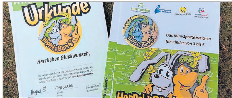
Mit Hase Hoppel und Igel Bürste zum Mini-Sportabzeichen.

Stolz nahmen die Kinder ihre Urkunde und das Mini-Sportabzeichen entgegen. Doch nicht nur die jungen Sportlerinnen und Sportler sowie die Erzieher und Erzieherinnen freuten sich über den gelungenen Tag: Auch der Elternausschuss, der die Aktion organisiert und durchgeführt hatte, zeigte sich begeistert über den Erfolg der Veranstaltung. Das Mini-Sportabzeichen war damit nicht nur eine sportliche Herausforderung, sondern vor allem ein erlebnisreicher Tag voller Bewegung, Teamgeist und Spaß.